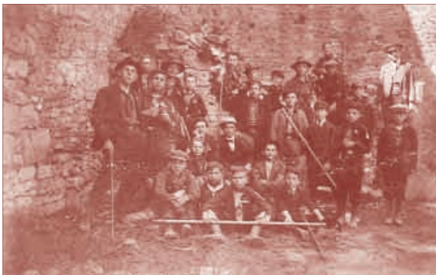
Na Hukvaldech před obědem (autor fotografií neznámý, text Zdeněk Bár)