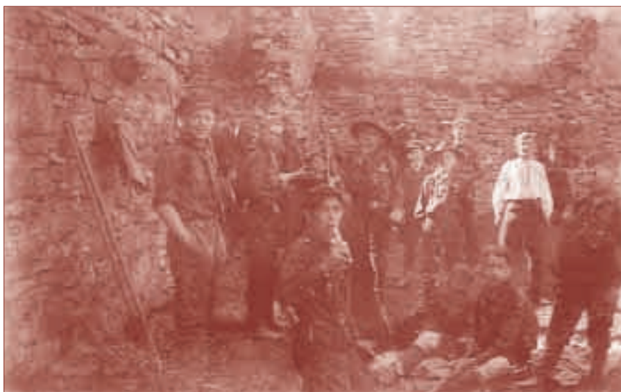
Na Hukvaldech při jídle (autor fotografií neznámý, text Zdeněk Bár)