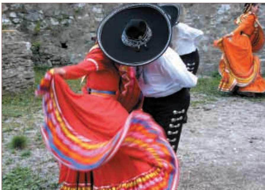
Koncert mexického souboru Hueyitlatoani, 23. srpna 2007, foto Jaroslav Michna.