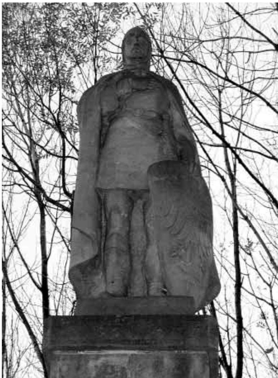
Jan Kozel — Socha sv. Václava z r. 1994.