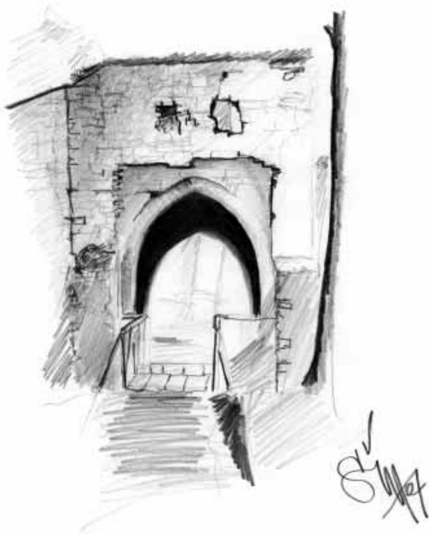
Hukvaldská brána, kresba Šimon Mareček.