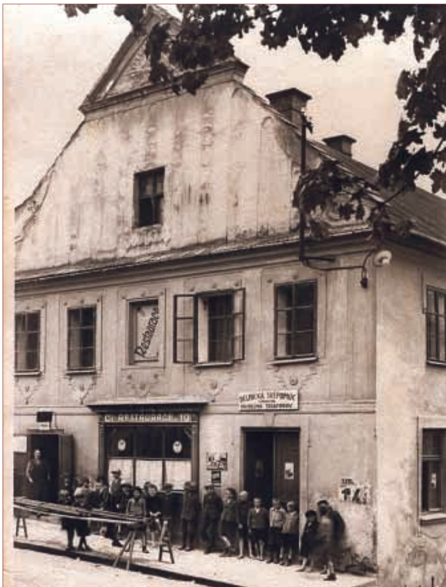
Starý Štramberk, autor fotografie neznámý.