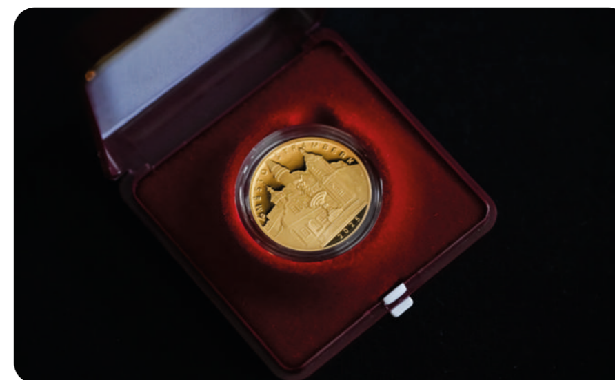
Zlatá mince ČNB – Městská památková rezervace Štramberk – 2025

Cena se uděluje každoročně obci, městu či městy, která má na svém území městskou památkovou rezervaci či zónu a je aktivně zapojena do Programu regenerace MPR a MPZ. Oceněná obec pak má právo rok užívat titul Historické město roku. Samotnou cenou je umělecké dílo z českého křišťálu, vyrobené ve sklárně v Nižboru. Na originál se postupně přepisují vítězové a zůstává při SHSČMS, kopie