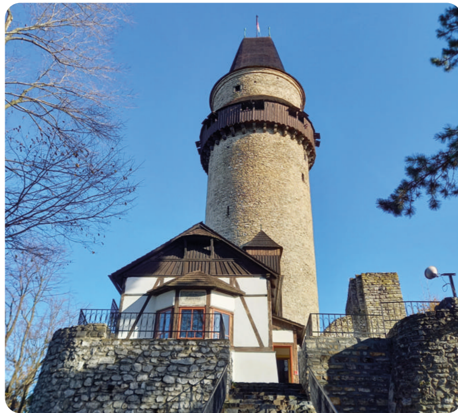
Památka roku 2025 v MS kraji 2. kategorie – velká – „Areál hradu Štramberk s věží Trúba“

Slavnostní vyhodnocení celostátní soutěže Památka roku 2025 proběhne ve čtvrtek 26. března 2026 v Klatovech, za účasti zástupců Sdružení historických sídel Čech, Moravy a Slezska, Ministerstva kultury a Národního památkového ústavu. Pozváni budou všichni krajsští vítězové.