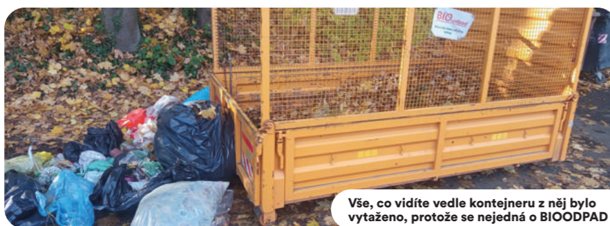
Vše, co vidíte vedle kontejneru z něj bylo vytaženo, protože se nejedná o BIOODPAD

pad dohromady. Toto chování nese problémy na kompostárně. Zbytečné placení vysokých částek za likvidaci odpadu, který by nám peníze do rozpočtu mohl spíše přinést.