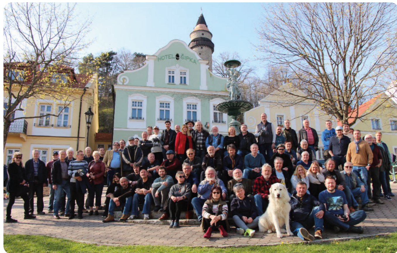
Setkání SPZB v dubnu 2025