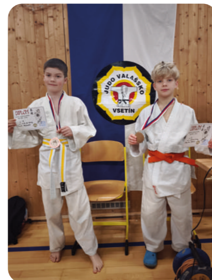
Zimní turnaj, Vsetín, 10. ledna