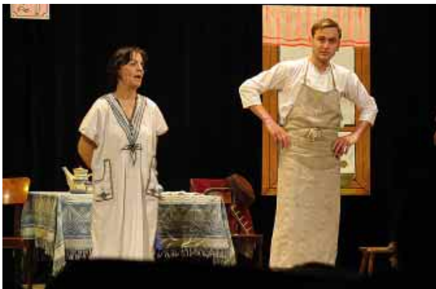
Divadlo pod věží: divadelní představení Švec Ondra a princezna Julinka, 1. prosince 2007.