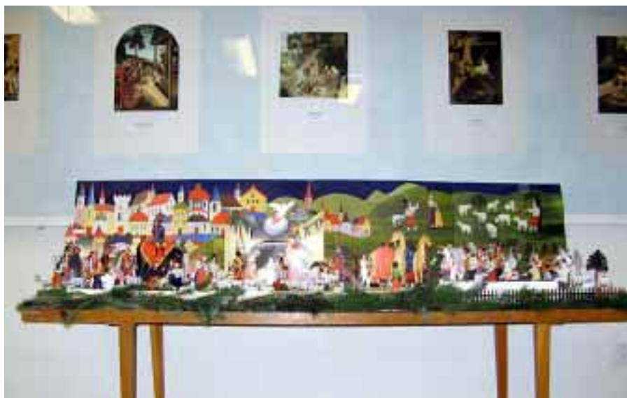
Štramberské Vánoce, 18. listopadu 2007.

Přeji všem čtenářům Zpravodaje, aby si při návštěvě kterékoliv kulturní akce připadali jako v nebi.