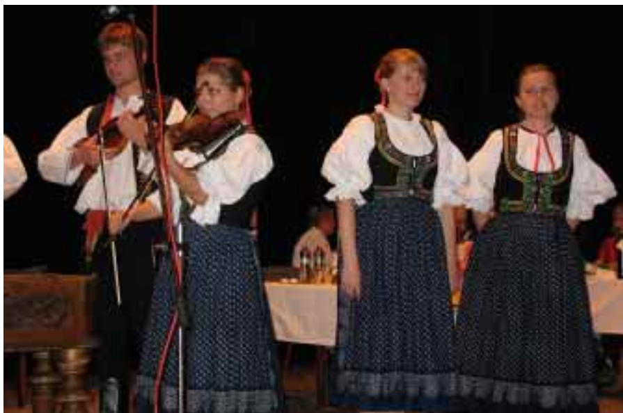
Cimbálová muzika Valašský vojvoda z Kozlovic: Posezení u cimbálu, 9. listopadu 2007.