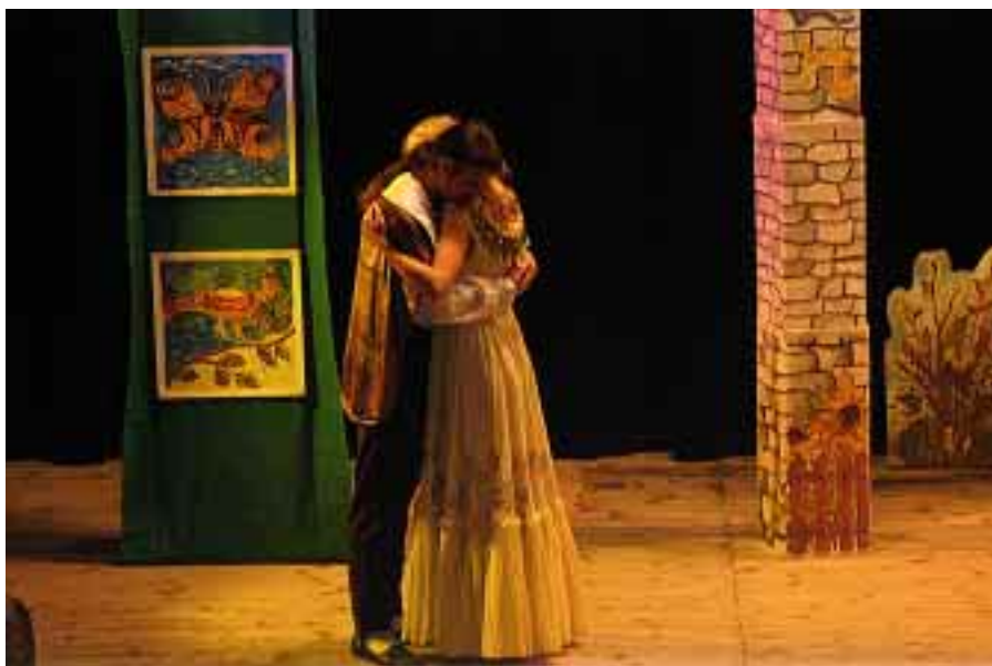
Pohádka O zlé královně, 1. listopadu 2007.