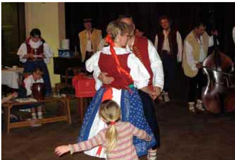
Přidťe na pobabu: cimbalová muzika Javorník, 7. prosince 2007.