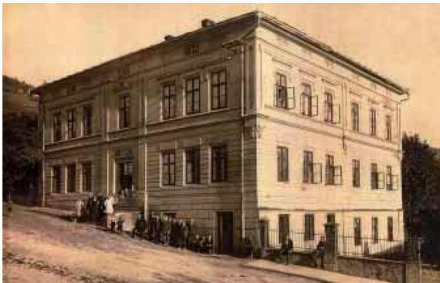
Škola na náměstí, 1. polovina 20. století.

Ale ať už počítáme na dětském počítadle nebo na novodobém stroji, výsledek je pořád stejný. Ušli jsme jen notný kus od břidlicové tabulky k dnešku.