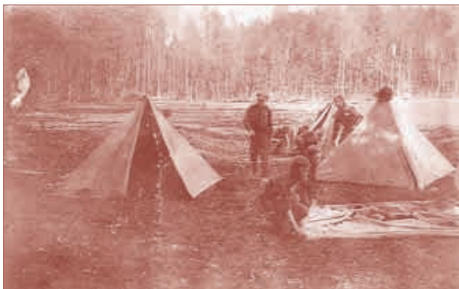
Přípravy ku slibu: Stavění stanů (text Zdeněk Bár)