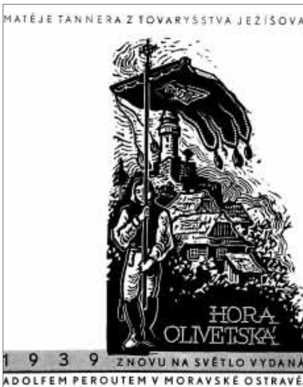
Matěj Tanner „Hora Olivetská“ (A. Perout, Ostrava, 1939, kresba Ferdyš Duša)