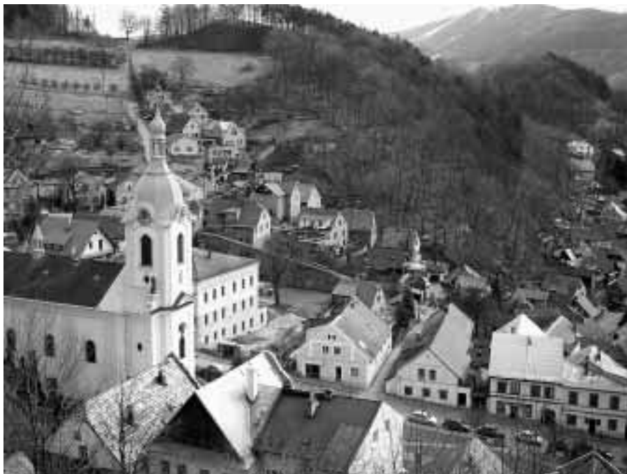
Štramberk na fotografii Jaroslava Michny, 3. dubna 2006