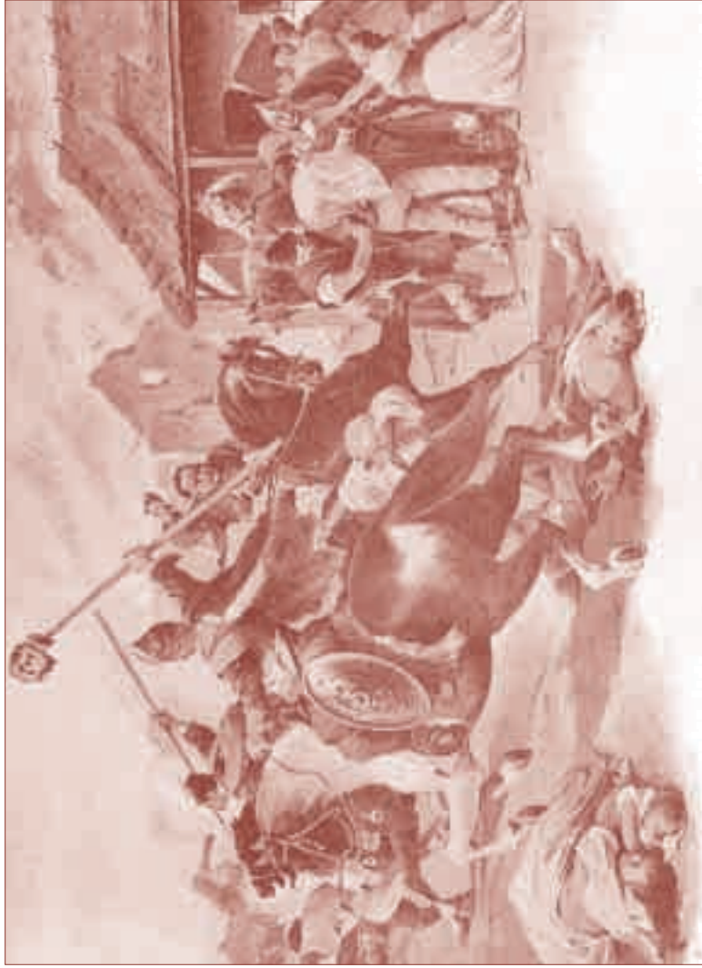
Věnceslav Černý „Řádění Tatarů na Moravě“ (Rezek – Dolenský – Kosina Obrázkové Dějiny národu českého, Praha 1924)