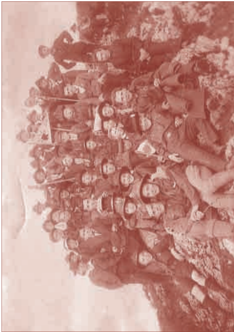
Skupina skautů, kteří zúčastnili se sborové schůzky na Kotouči (autor fotografie neznámý, text Zdeněk Bár)