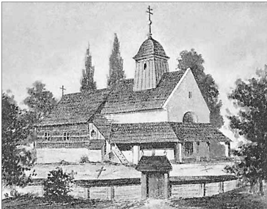
Kostelíček sv. Kateřiny (Moravské Kravařsko, Příbor, 1898, autor neznámý)