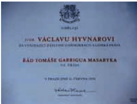
Řád TGM udělený Václavu Hývňarovi