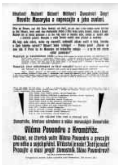
Vlevo volební leták.