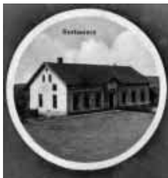
Hostinec Pod Trúbou.