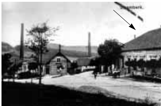
Vpravo hotel Kahánek.

Závěrem můžeme ocitovat jeho vlastní slova z roku 1998: „Pomáhal jsem rodné zemi pokud jsem mohl a kraji pod Štramberskou trúbou jsem hanbu neudělal za těch padesát let exilové pouti...“