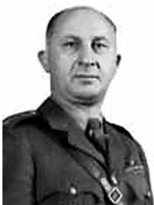
Gen. Bruno Sklenovský

Po útěku za hranice byl 14. 2. 1949 degradován na vojína. Jeho další stopy v exilu se ztrácejí a podle ústních svědectví bývalých spolubojovníků se usadil v kanadském Torontu, kde v 1. srpna 1957 i zemřel.