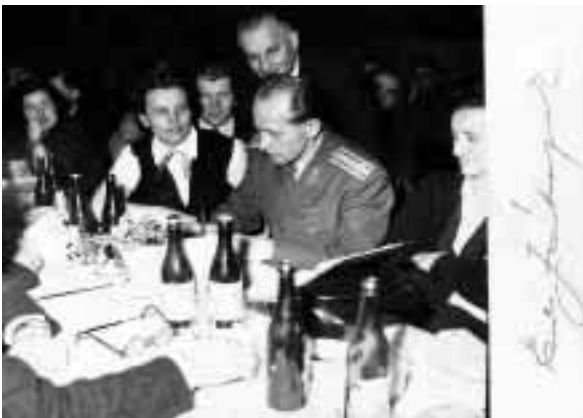
Emil Zátopek mezi přáteli.

Slunce už bylo vysoko a bylo značně teplo. Usedli jsme v zahradě pod starou