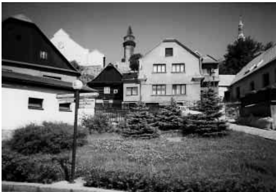
Zde stávala chalupa čp. 243, dnes je tu parčík.

Kdyby ty štramberské chalupy mohly mluvit!