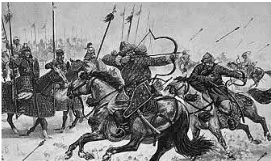
Mongolové na Moravě.

*) Kosina–Bartoš „Malá slovesnost“, 1876, Jan Havelka