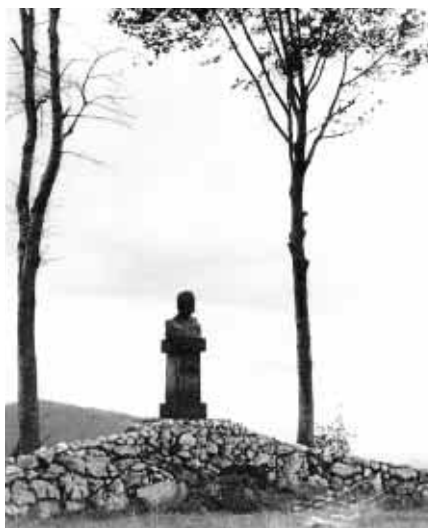
Busta Bedřicha Smetany — dílo akad. sochaře Jana Štursy bylo odhaleno 20. 7. 1924, Národní sad na Kotoouči. Autor fotografie a rok neznámý.