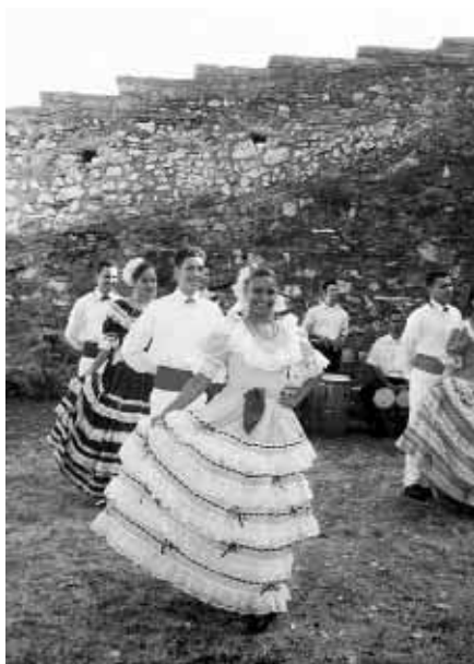
Profesionální portorikánský taneční soubor Guamanique, 21. června 2004.