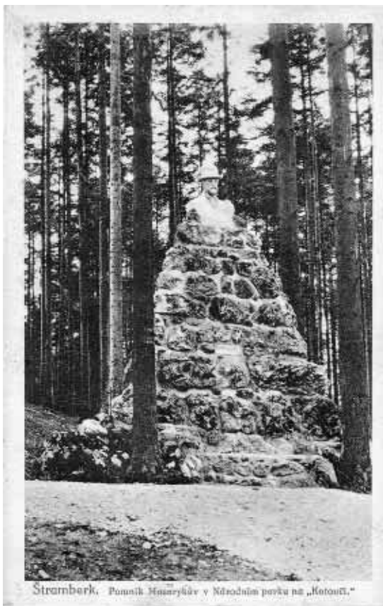
Štramberk, Památník Masarykův v Národním parku na „Kotouči.“