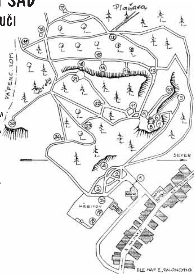
Mapa Národního sadu na Kotouči, tisk KČT Štramberk, r. 1946; č. 28 dodatečně doplněno B. Krestou.