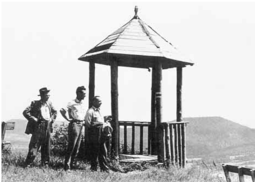
Gloriet na východní straně Kotouče byl postaven v r. 1923. Autor fotografie a rok neznámý.