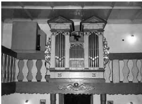
Památné varhany v kostelíčku sv. Kateřiny.