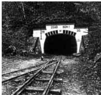
Vchod do štol.

Dále tam vystavit železoocelový vrták čili borek, na který ze začátku při vrtání díry tloukli dva kladivy, později jeden perlíkem. A tato kladiva a perlík k vrtací tyči přiložit. Později byly vrtáky poháněné vzdušným proudem, který byl kompresorem ze strojovny potrubím tlačěn do vrtáků, aby poskakovaly a svými ostrými zuby vrtaly díru. Vrták byl zatížen masivní rukojetí pro větší tlak při vrtání. Takže zvonivý zvuk, který se z Kotouče ozýval po štosech kladiva na železoocelové tyče, se pak změnil v rečtání poskakujících vrtaček poháněných vzdušným proudem.