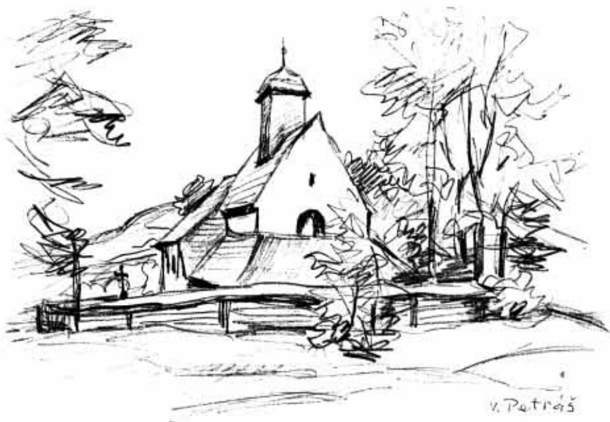
Vojtěch Petráš — Kostelík sv. Kateřiny

Razítko kostelního konkurenčního výboru ve Štramberku.