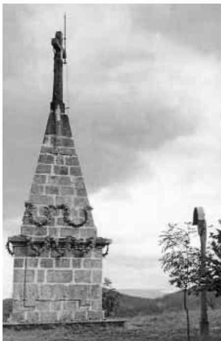
Mohyla se sv. Křížem z r. 1884 byla v r. 1918 přemístěna nad jeskyní Šipka.

Tolik pamětihodností na území tak malého města, to je určitě pro mnohé návštěvníky překvapivé. Bohužel, ne všechny v dřívější době zaniklé památky se dají dnes nahradit. Je pravdou, že mnoho soch, bust a pamětních desek zase přibýlo, z čehož je vidět, že občané nezapomínají a budoucím generacím rozšířeně přenechávají to, čím byli sami okouzlováni. Vzpomínky opředené krásou.