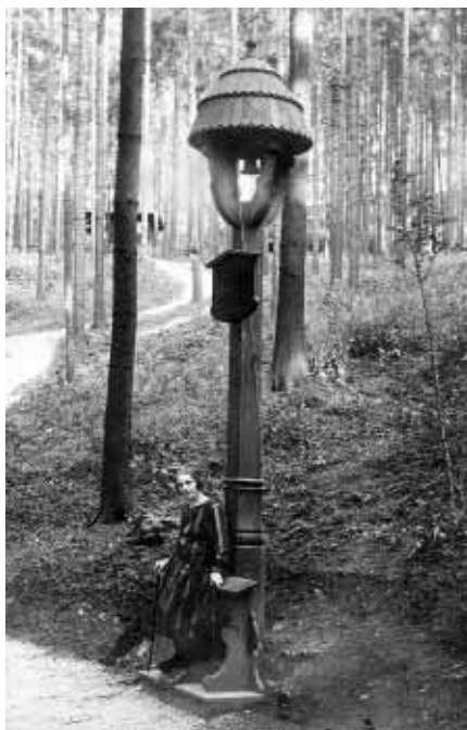
Dřevěná zvonička na Kotouči pod Perníkovou chaloupkou z května 1923.