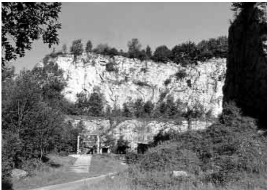
Průčelí radvanických tunelů, 4. 7. 2005.

Význam pokusných štol podtrhuje ta skutečnost, že v zemích EU kromě pokusných štol ve Štramberku existuje podobný komplex pokusných podzemních chodeb, kde může být řešena problematika bezpečnostního inženýrství, pouze v Polsku.