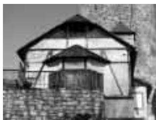
Současný pohled na někdejší útulnu U Mědínek. Dnes je na ní název U Jaroňků.