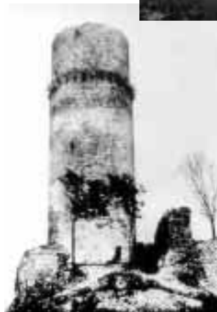
◀ Zřícenina Trúby.