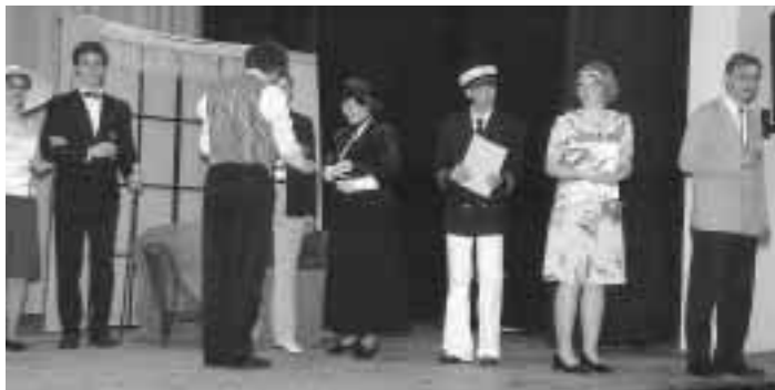
Opereta Rudolfa Piskáčka „Tulák“.

Závěrem musím konstatovat, že všechny soubory odvedly maximální výkon, v rámci svých možností a my se můžeme jen těšit na jubilejní X. Divadelní přehlídku amatérských souborů v roce 2007.