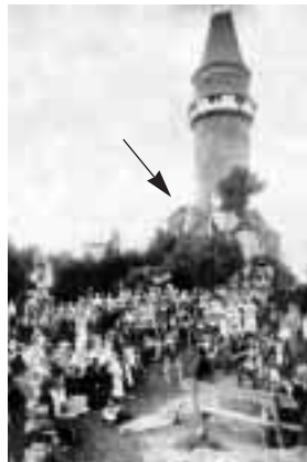
Historická slavnost na Trúbě. U Trúby nově otevřená útulna U Mědínek (označená šipkou).