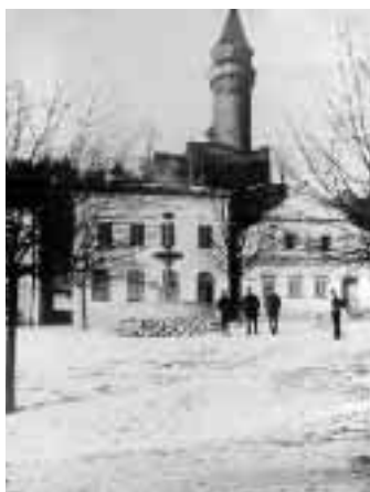
Hostinec U Jaroňků.