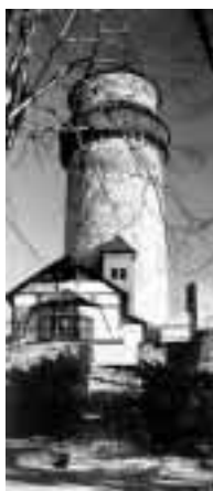
Trúba v současnosti.