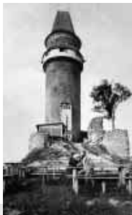
▲ Trúba po opravě, s verandou.

◀ Uvažovaná podoba úpravy hradu na pro- pagační pohlednici.