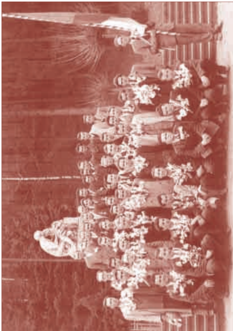
Štramberští rekruti, 4. 4. 1949