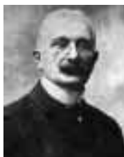
Rakouský ministr baron Gautsch.

◀ Uvažovaná podoba úpravy hradu na pro- pagační pohlednici.