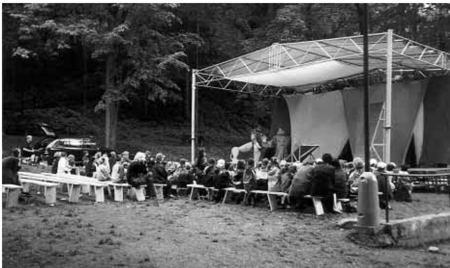
Zámecké divadlo z Vranové Lhoty v Národním sadu s představením Kouzelník ze země OZ, 4. června 2004.

Také v arboretu měli ostravští jeskyňáři připraven pro děti Dětský den v arboretu — lanový traverz nad arboretem na dny 5. a 6. června. Počasí se moc nevydařilo, ale několik zájemců se přece jen svezlo po laně dlouhém 250 m nad botanickou zahradou.