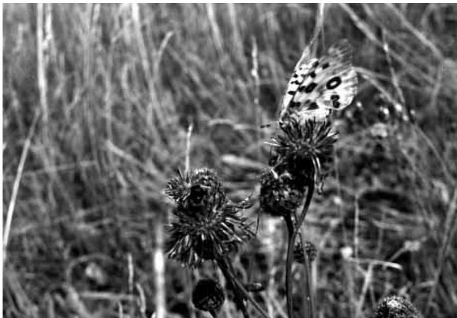
Motýl Jasoň Červenooký ( Parnassius Apollo , L. var. Strambergensis ) na fotografii Jaroslava Michny.

Jedním z projektů, které od počátku považujeme za citlivé k životnímu prostředí, je snížení průjezdu motorových vozidel historickou a navazujícími částmi města. Jde o turistickou osobní a hromadnou dopravu a nevhodné parkování vozidel na náměstí, pod okny základní školy a v blízkosti obytné zástavby. První část projektu byla realizována pod sokolovnou na Zauličí koncem loňského roku se zavedením plného provozu v jarních měsících sympatickým způsobem. K tomu, aby bylo dosaženo plného ekologického efektu, je nezbytné vybudování záchytného parkoviště na opačné straně města (to je druhá část záměru) pod restaurací Dallas směrem k Novému Jičínu.