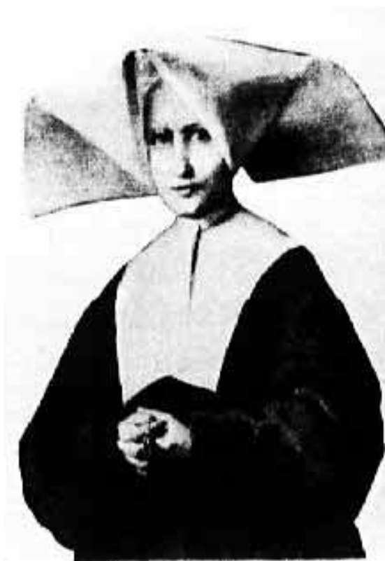
Catherine Labouré (1806—1876, Francie)