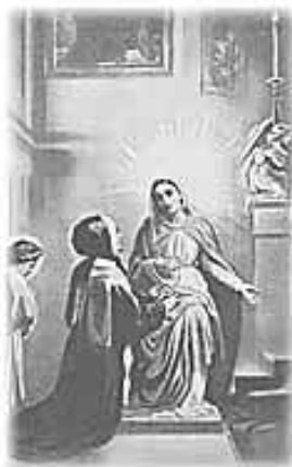
Zjevení Panny Marie v pařížském Chapel Rue du Bac, 19. 6. a 27. 11. 1830.