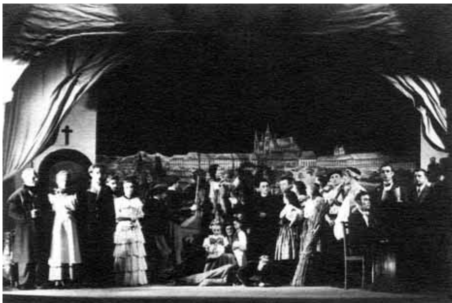
Divadelní představení ochotnické divadelní scény Lidového divadla ve Štamberku na Okresní divadelní soutěži 21. 3. 1948 Štamberk — Sokolovna živý obraz

Válka skončila a odchodem vynikajícího varhaníka ze Štamberka se toto velké společenství chrámového sboru rozměnilo. Mládež odešla do škol a mnozí členové přešli za svými novými zájmy. Aktivní činnost obnovily předválečné spolky jako Sokol, Orel, DTJ, které při tělovýchově se věnovaly také ochotnickému divadlu. Je bez pochyb, že v jejich repertoáru nebyly jen činohry, ale také zpěvohry a operety. V těch se velmi dobře uplatnili bývalí členové chrámového sboru. Ale staré přísloví praví „Dvěma pánům nelze sloužit“. Neslučitelné bylo účinkovat ve sboru a současně na divadelních prknech spolku. Narušování zkoušek zapříčinily nové zájmy členů. Chrámový sbor, alespoň s menším po-