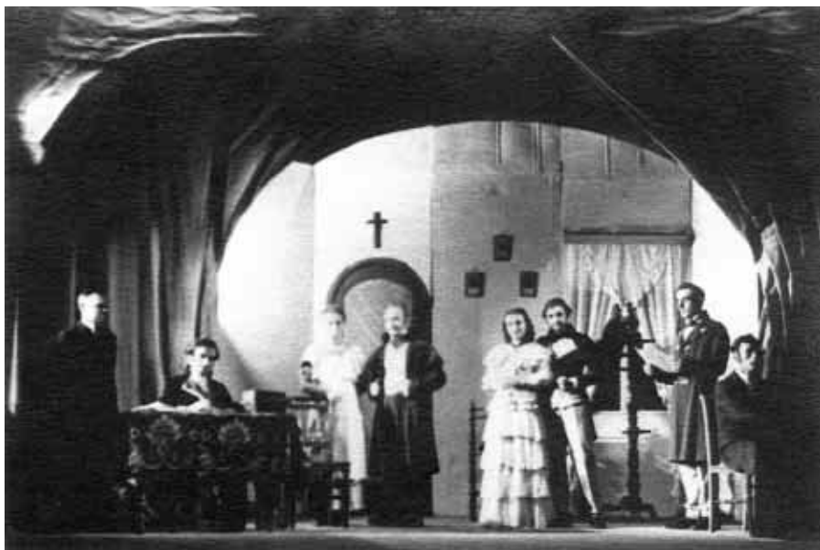
„Kde domov můj“ 21. 3. 1948 Lidové divadlo ve Štamberku 2. místo v Okresní divadelní soutěži 1948 Štamberk — Sokolovna