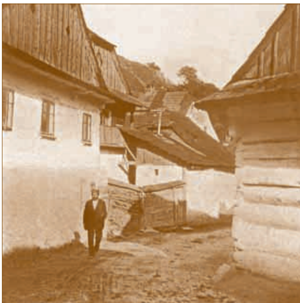
Štramberk na dobových fotografiích v roce 1913.