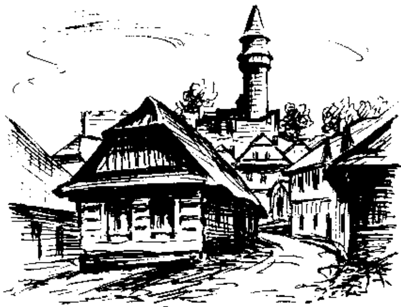
Vojtěch Petráš — Štramberský motiv