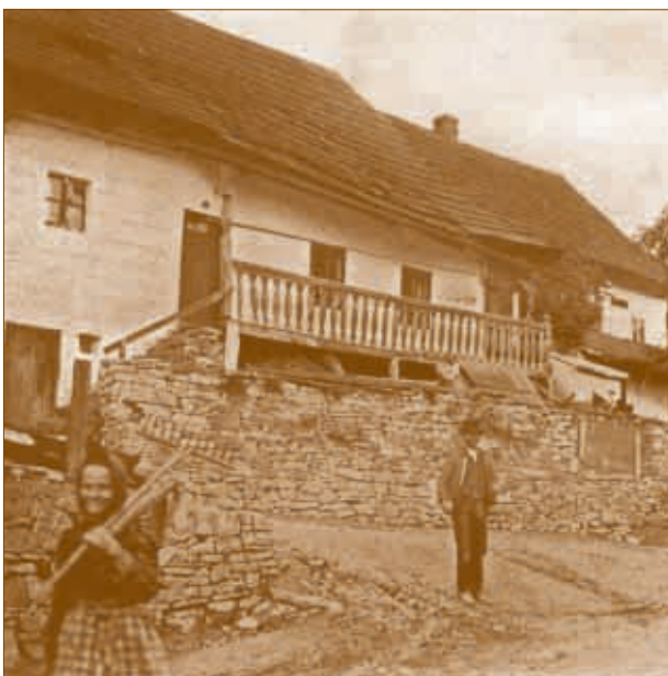
Štramberk na dobových fotografiích v roce 1913.