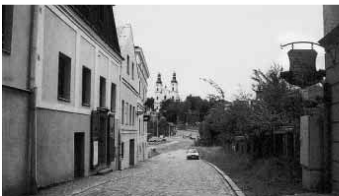
Pohledy do ulice Hluboké ve Frýdku počátkem 20. stol., o 70 let později a o dalších 30 let později. V prostoru za autem dnes stojí Kaufland.