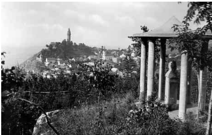
Od 1. července 1927 se Leoš Janáček dívá ze štramberského Kotouče na rodné Hukvaldy.