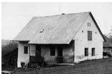
Vlevo čp. 135 na Skalce, (foto z r. asi 1975) Vpravo čp. 358 u Libotína, (foto okolo r. 1959)

Na fotografii p. Ladislava Geryka, pravděpodobně z poloviny 70. let 20. stol., je zachycen dnes už neexistující domek čp. 135 na Skalce.