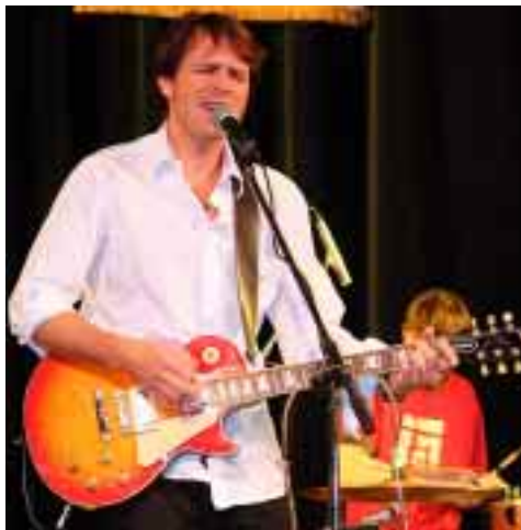
Koncert Janka Ledeckého Kulturní dům Štramberk, 24. ledna 2008