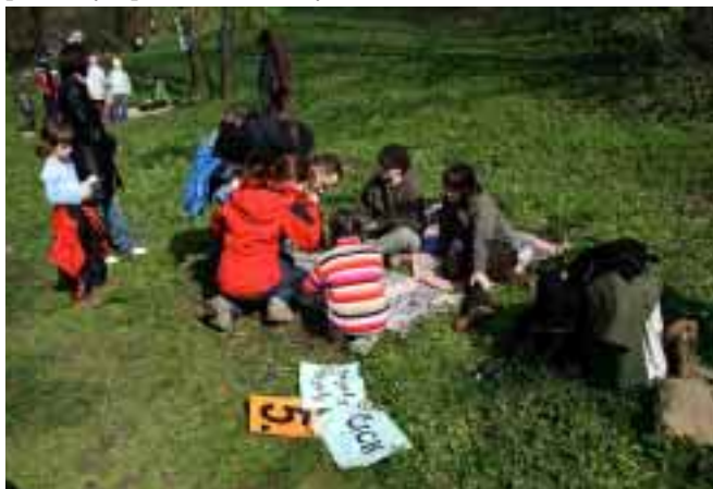
Den Země 2008 — zkouška čichu.

Oslava Dne Země proběhla v sobotu 26. dubna 2008. Letos jsme spojili síly s Městem Koprivnice, DDM Koprivnice, DDM Štramberk, ČSOP Štramberk a o. s. Hájenka Koprivnice. Pro děti a jejich rodiče byly připraveny dva okruhy, které začínaly a končily na Kamenárce. Velký (2,5 km dlouhý) okruh nesl název Pohádkový les. Vedl na Bílou horu a přes Vánův kámen a byl plný pohádkových bytostí. Stateční poutníci zde zdolávali překážky a plnili různé úkoly.