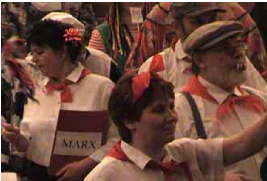
Divadelní maškarní bál, 2. února 2008.