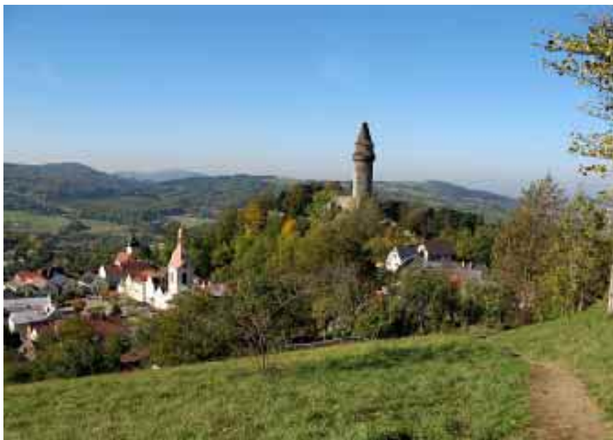
Štramberk 2007.

Dne 29. dubna se starostka zúčastnila semináře Financování památek z fondů Evropské unie v Rychnově nad Kněžnou, kterou pořádalo Sdružení historických sídel Čech, Moravy a Slezska.