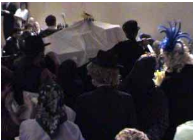
Divadelní maškarní bál — pochováání basy, 2. února 2008.