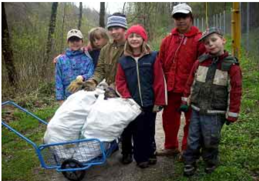
Uklidme Štramberk — děti ze Sdružení přátel Jaroslava Foglara „Tygří dráp“ při úklidu okolí Retenční nádrže na Libotíně.