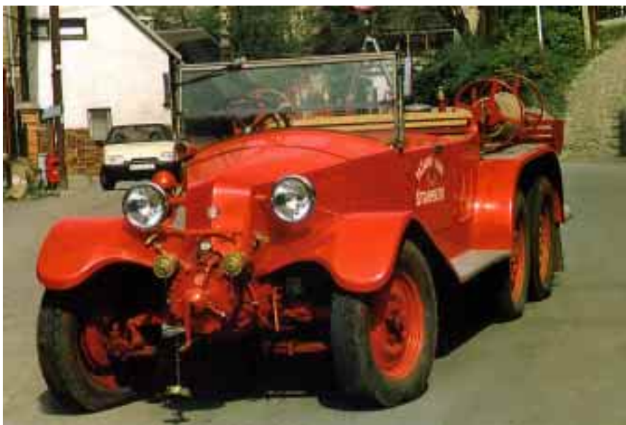
Hasičský historický dopravní automobil TATRA 26/30 „stařenka“, výroba 1929