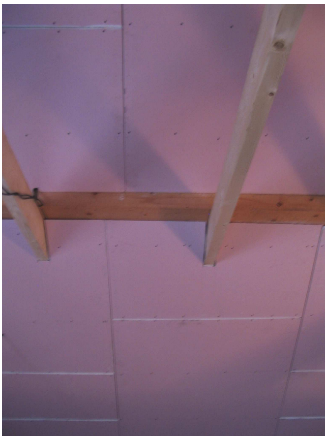
Obrázek č. 3 – sanace krovu