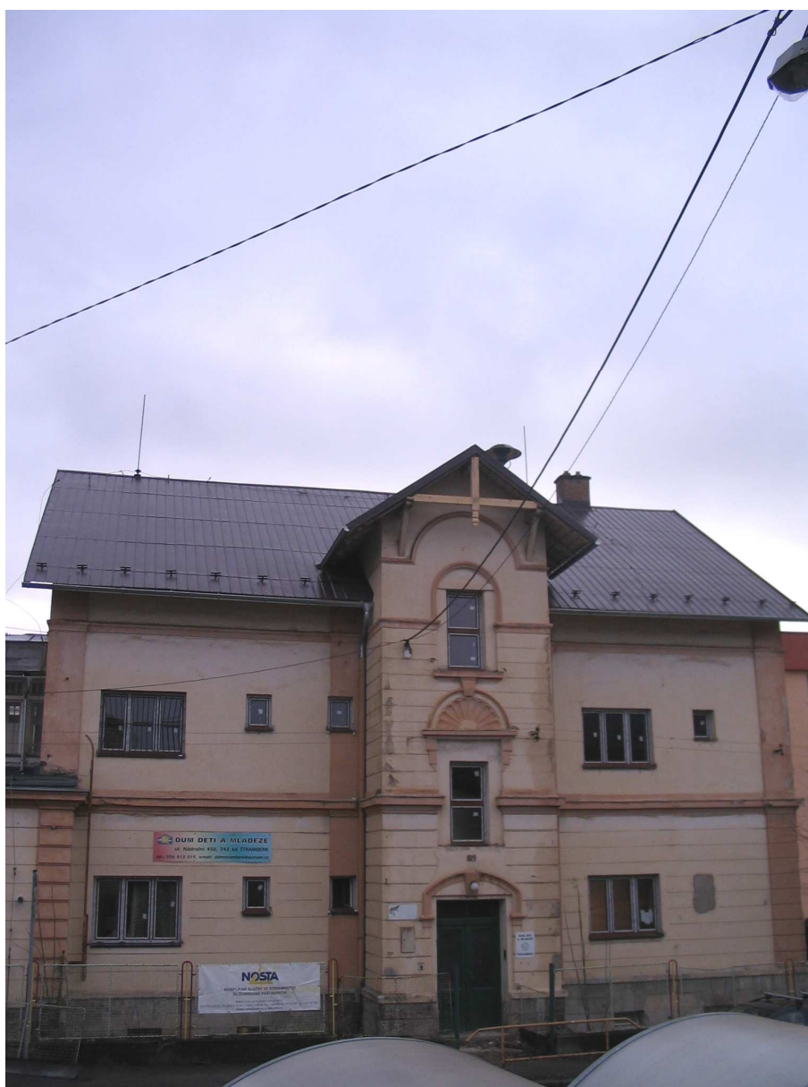
Obrázek 1 – střecha objektu – výměna střešní krytiny