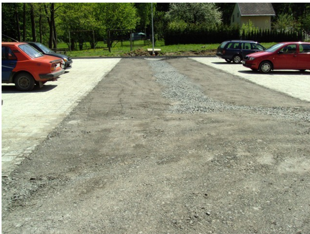
Obrázek č. 3 další dokončené parkoviště v severovýchodní části sídliště