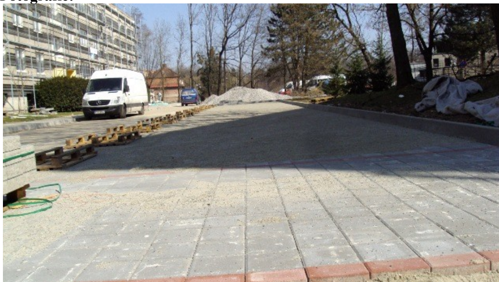
Obrázek č. 1 – první, již dokončené parkoviště v severovýchodní části sídliště