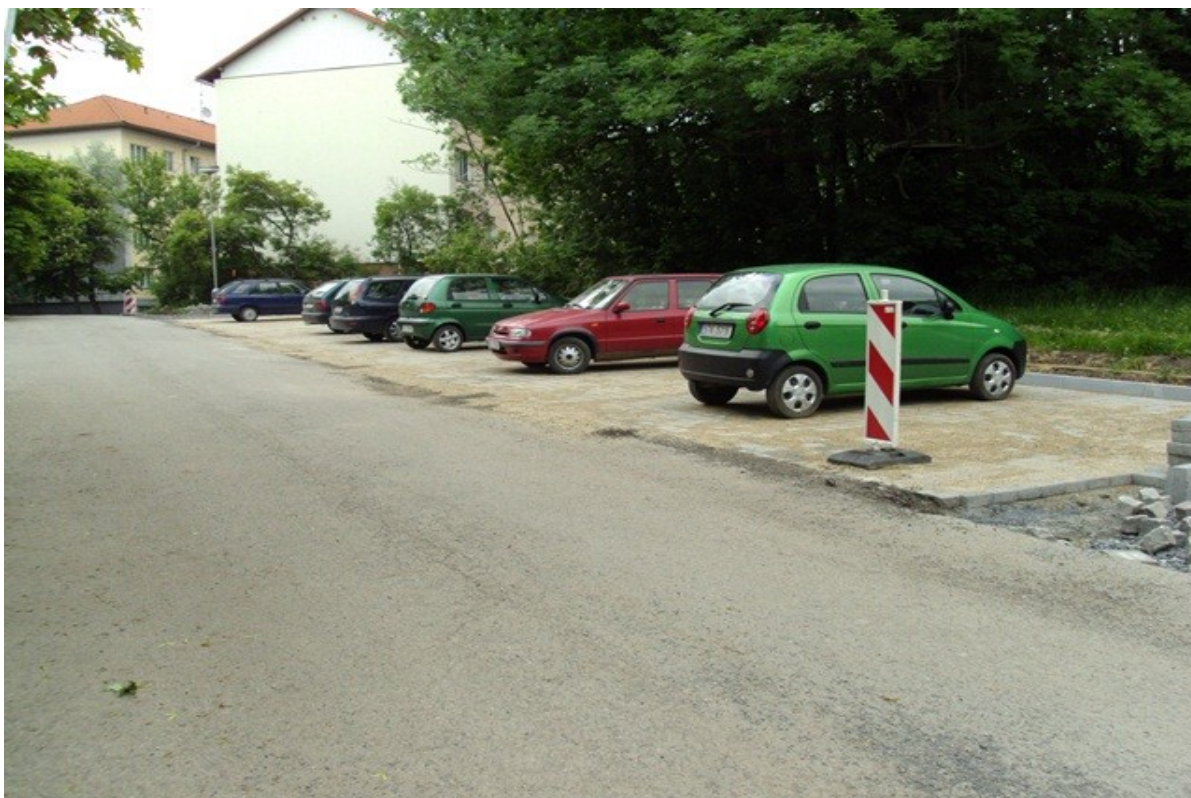
Obrázek č. 5 další dokončené parkoviště v severovýchodní části sídliště