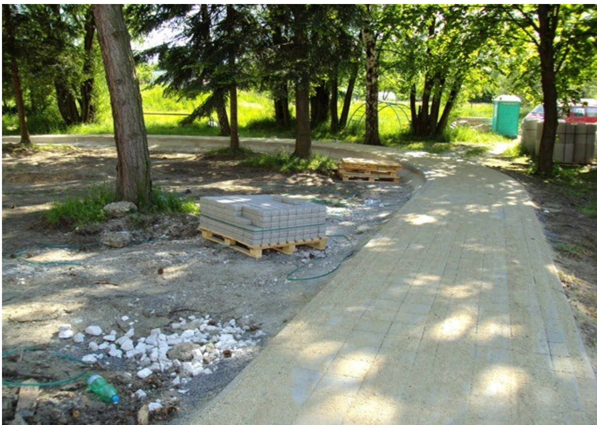
Obrázek č. 6 chodníky kolem dětského hřiště