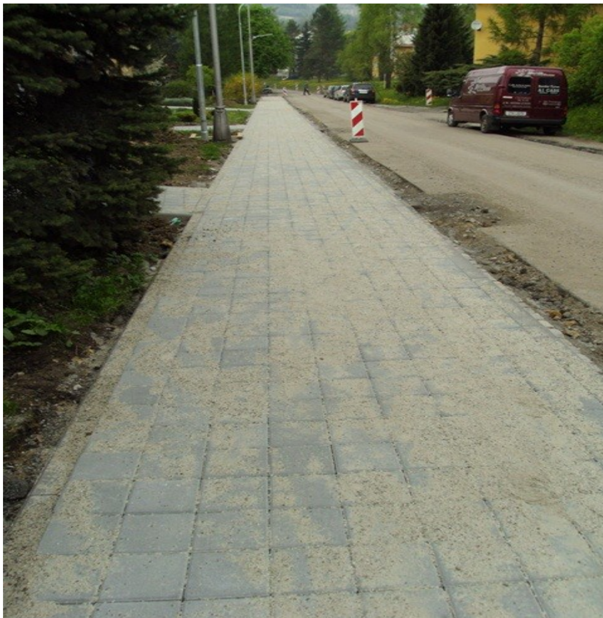
Obrázek č. 4 chodník podél hlavní místní komunikace kolem domů č.p. 741-746