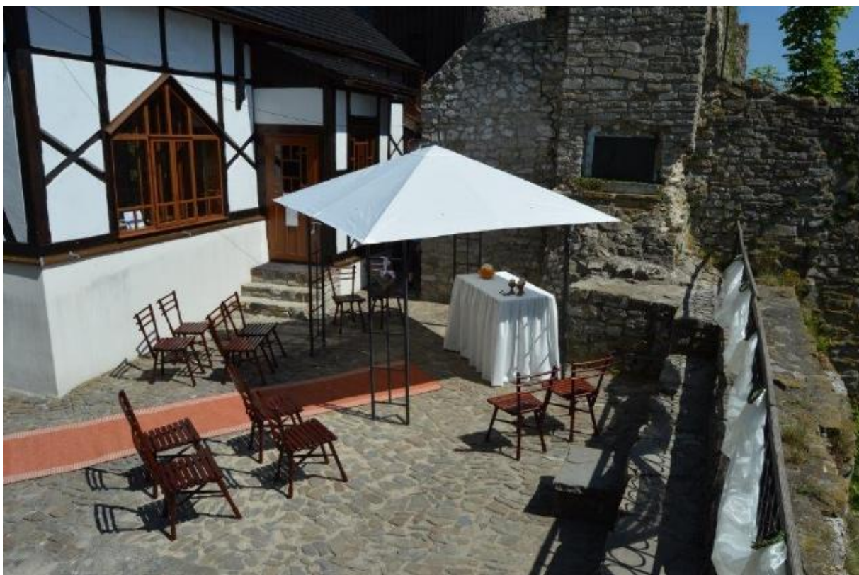
Trúba – horní nádvoří

Poplatek uhradí snoubenci městu Štramberk při podání žádosti o povolení uzavřít sňatek na jiném vhodném místě nebo mimo stanovenou dobu na pokladně Městského úřadu ve Štramberku (lze i platební kartou).