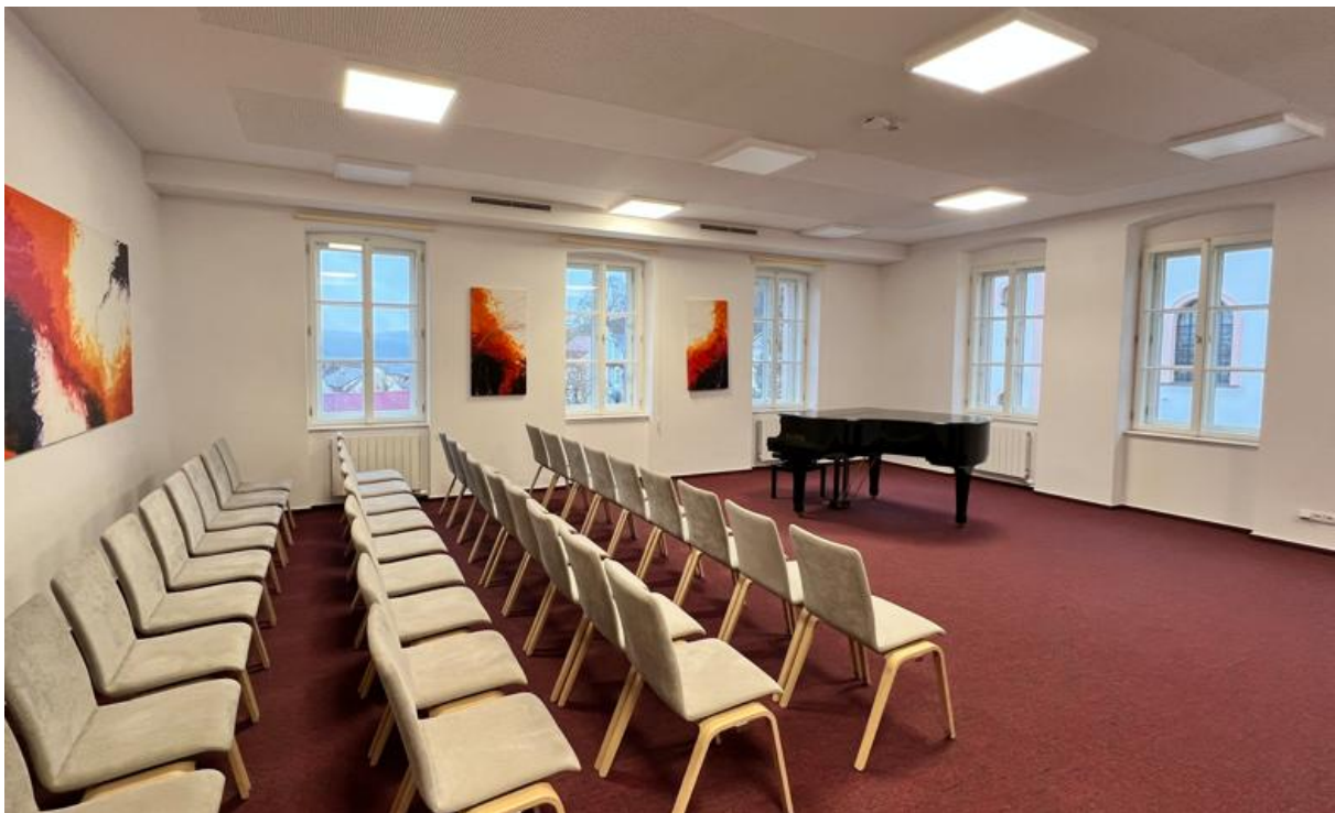
Obřadní síň – hudební sál Komunitního centra Stará škola

Občané s trvalým pobytem ve Štramberku platí z výše uvedených poplatků 50 %. Netýká se správních poplatků dle zákona 624/2004 Sb., o správních poplatcích.